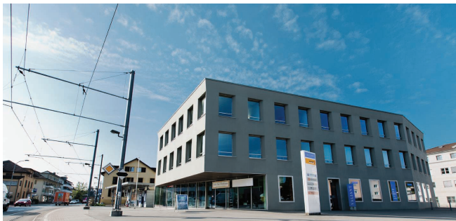
Regional gut verwurzelt: Der ganzheitliche IT-Partner AS infotrack am Zentrumsplatz 3 in Unterkulm.

Die AS infotrack AG in Unterkulm ist ein Informatik-Dienstleister, dem die Kunden seit 25 Jahren ihre IT-Vorhaben anvertrauen. Als ganzheitlicher IT-Partner ist das Unternehmen ein Kompetenzzentrum für überzeugende, nachhaltige Lösungen mit umfassenden Dienstleistungen.